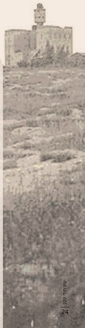
משטרת נבי יושע, 1938

המתקפה השנייה נערכה ב-20 באפריל והוטלה על פלוגה א' מהגדוד השלישי, בפיקודו של יצחק הוכמן. היחידות חולקו לשני כוחות עיקריים, כוח פריצה וחבלה וכוח רתק והטעיה, ולצדם חבורת הפיקוד וכוח חסימה. כוח א' כלל את מחלקת הפריצה בפיקודו של דודו צ'רקסקי, שהיה ממקימי רמות נפתלי הסמוכה והכיר את השטח היטב. המחלקה מנתה כיתת חבלנים, שתי כיתות פורצים וכיתת עתודה, ומשימתה הייתה לתקוף את המצודה מצפון. הכוח