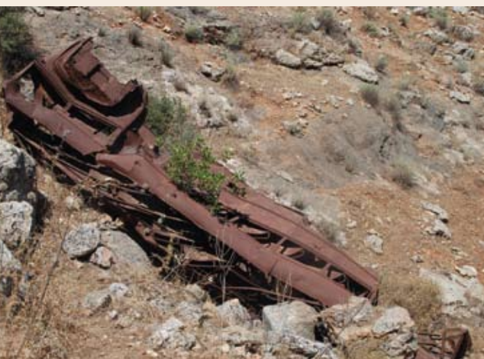
שלד האוטובוס המנוקב מההתקפה הראשונה, 15.4.48 (אותר ב'2012)

צויד בחומרי נפץ ובדרגש מיוחד להצבתם בהגבהה, כיוון שיסודות הבניין היו גבוהים בכ-60 ס"מ מעל הקרקע. תפקידו של כוח זה היה לנוע בסתר דרך הוואדי שמצפון, לבצע פריצה שקטה ואז לפרוץ את קיר הבניין בעזרת חומר הנפץ (שיונח על הדרגש הייעודי), ולהשתלט בסופו של דבר על המבנה כולו.