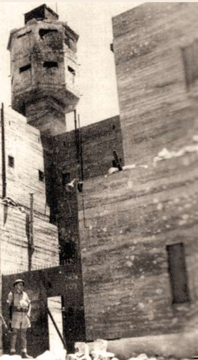
מצודת ישע מיד לאחר כיבושה, תש"ח

צויד בחומרי נפץ ובדרגש מיוחד להצבתם בהגבהה, כיוון שיסודות הבניין היו גבוהים בכ-60 ס"מ מעל הקרקע. תפקידו של כוח זה היה לנוע בסתר דרך הוואדי שמצפון, לבצע פריצה שקטה ואז לפרוץ את קיר הבניין בעזרת חומר הנפץ (שיונח על הדרגש הייעודי), ולהשתלט בסופו של דבר על המבנה כולו.