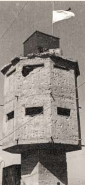
בתום הקרבות: מגדל המצודה מנוקב בכדורי "בראונינג"

לאחר קבלת תדריך, יצאו הכוחות מקיבוץ חולתה. עם תחילת ההיערכות התייצבו שתי משאיות במקום שלוש, מצב שהצריך את פיזור הלוחמים בעמדות הקרב בשני סבבים. שעת השי"ן נדחתה – וזמן יקר אבד. הכוח הפורץ בפיקודו של דודו הורד סמוך לכפר ג'חולה, בפתח הוואדי העולה אל נבי יושע. יתרת הכוח הוסעה במעלה הכביש לכיוון נבי יושע והחלה להפעיל בהר עד רמות נפתלי.