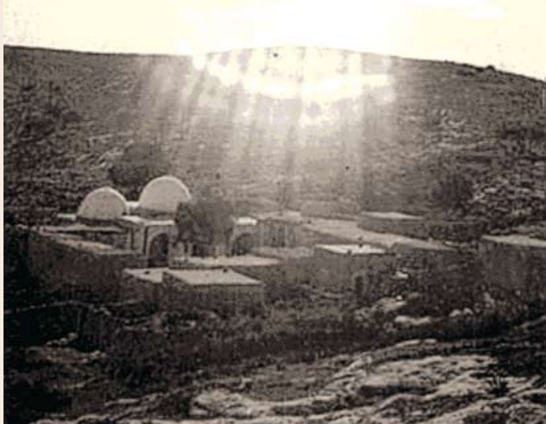
קבר נבי יושע, שנות ה-40