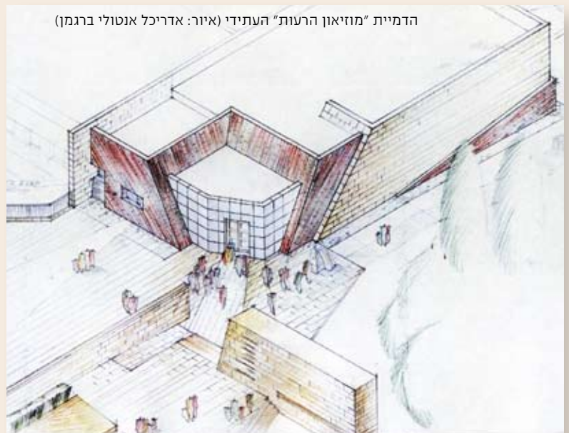
הדמיית "מוזיאון הרעות" העתידי (איור: אדריכל אנטולי ברגמן)

במצודת כ"ח פועלת כיום קריית החינוך של משמר הגבול. אלפי לוחמי החיל עולים למקום מדי שנה ומשלבים לימודי חינוך, פעילות להנחלת ערכים ומורשת קרב. מוזיאון הרעות העתידי יאפשר לבני נוער ולמבוגרים ללמוד על תולדות ההתיישבות בגבול הצפון, על הקרבות לכיבוש המצודה ועל תולדות משמר הגבול.