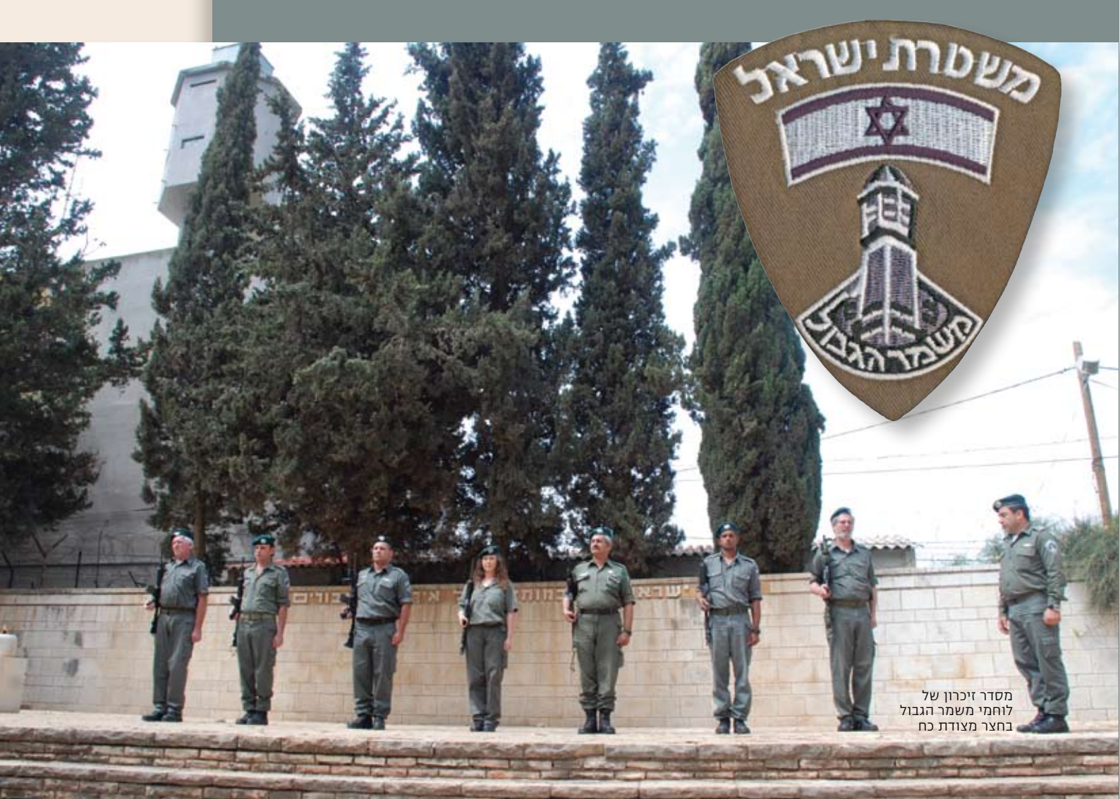
מסדר זיכרון של לוחמי משמר הגבול בחצר מצודת כ"ח