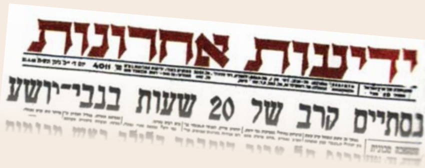
"ידיעות אחרונות" 21.4.48 - תיאור ההתקפה השנייה, שנכשלה

כשלוחמיה היגעים נושאים עמם את הפצועים. 22 גופות נותרו בשטח שסביב המצודה, בלי יכולת לחלץ.